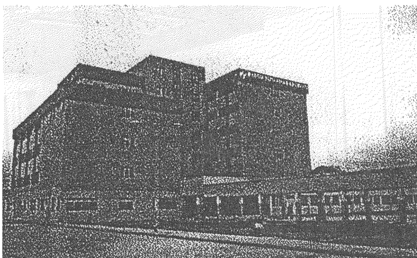
Foto 17. Panorámica Hospital Dávila Córdova de Chone