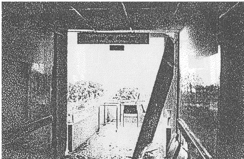
Foto 16. Desprendimiento de puerta de rejas hacia escaleras de emergencia (Hosp. Miguel Alcívar)