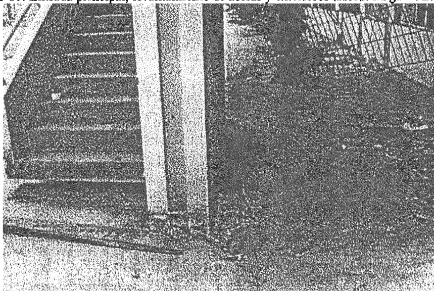
Foto 11. Alteración del piso en bloque de escaleras (Hosp. Miguel Alcívar)