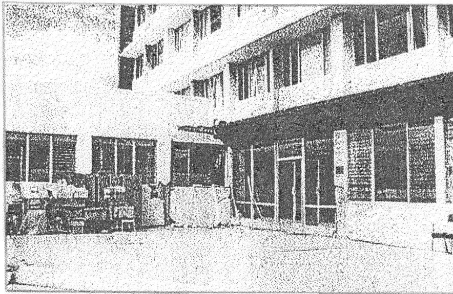
Foto 10. Entrada principal, levantamiento de aceras y exteriores (Hosp. Miguel Alcívar)