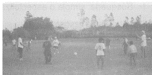
Niños en actividades recreativas. (Foto tomada de http://www2.bc.edu/~garbach/ ).