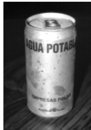
Coordinación y apoyo de la empresa privada, para la distribución de agua, Venezuela, 1999

Cada región tiene características propias, por lo que es conveniente que se pueda analizar la idiosincrasia del lugar e incorporar, en el proceso de desarrollo de los planes de emergencia, a las fuerzas vivas locales y, al igual que se realizan convenios previos con la empresa privada, se alcancen compromisos con estos grupos comunales. Dentro de esta negociación, la comunidad debe ser capacitada y adiestrada, para lo cual la misma organización comunal puede contribuir en estas tareas.